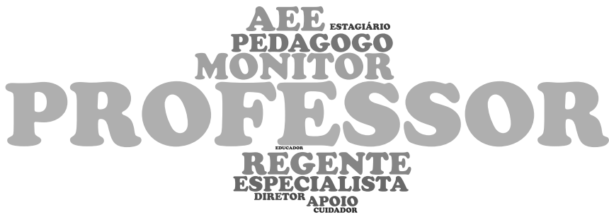
Figura 2 – Nuvem de Palavras da categoria serviços e apoio especializado da educação especial numa perspectiva inclusiva 7 .