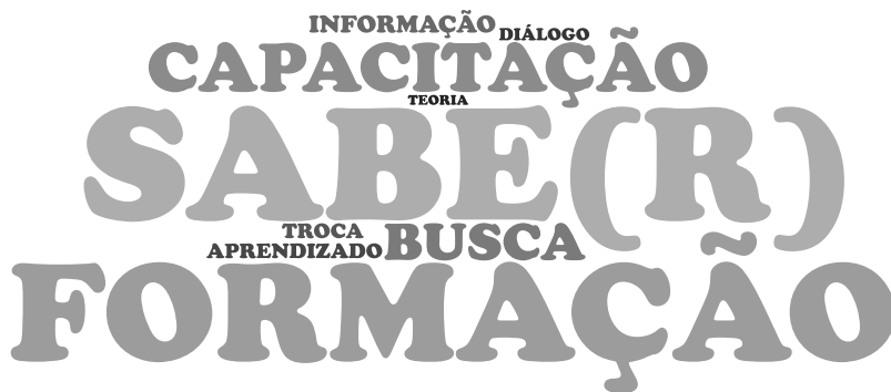
Figura 3 – Nuvem de Palavras da categoria Formação 9