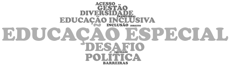
Figura 1 – Nuvem de Palavras da categoria Educação Especial numa Perspectiva Inclusiva 5 .