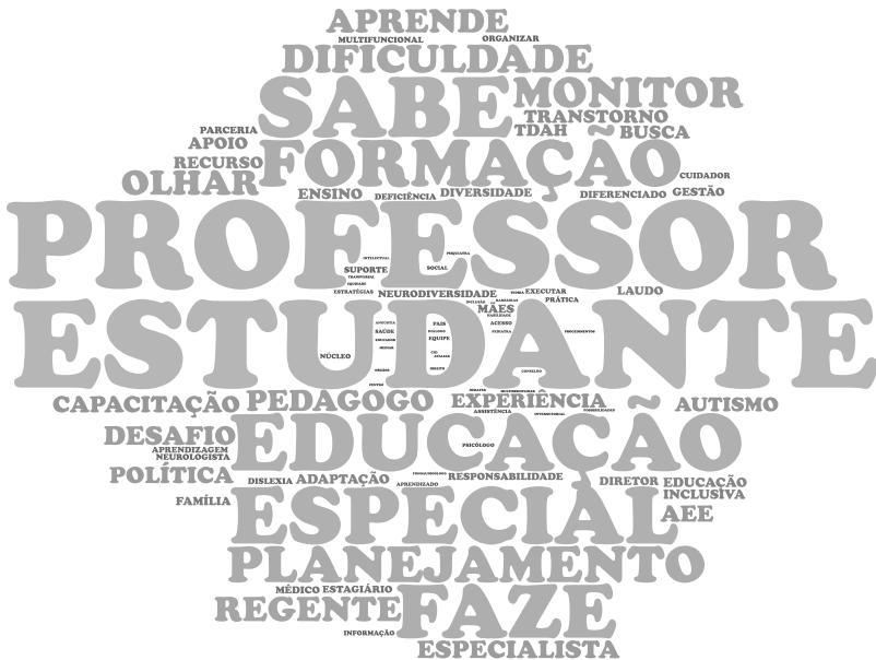
Figura 6 - Nuvem de palavras de todas as categorias 13