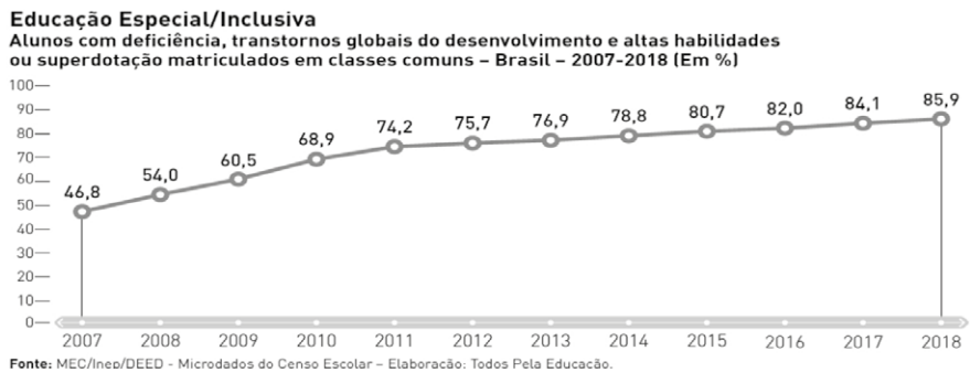
Figura 1 – Porcentagem de matrículas de estudantes público da Educação Especial