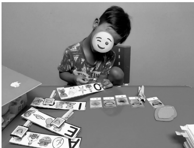
Imagem 1 — Fotografia de uma atividade pedagógica voltada ao desenvolvimento da consciência fonêmica, utilizando o método “Boquinhas” 6