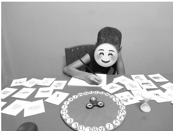
Imagem 6 – Fotografia de uma atividade pedagógica realizada por uma criança, com o rosto coberto, sentada à mesa azul 11