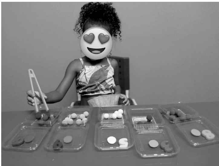
Imagem 7 — Fotografia de uma atividade pedagógica de classificação realizada por uma criança, com o rosto coberto, sentada à mesa azul 12