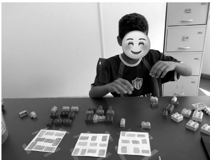
Imagem 4 — Fotografia de uma atividade pedagógica realizada por uma criança 9