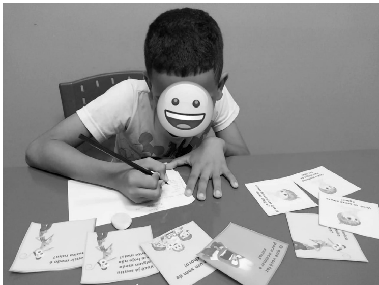
Imagem 3 – Fotografia de uma criança realizando atividade de escrita 8