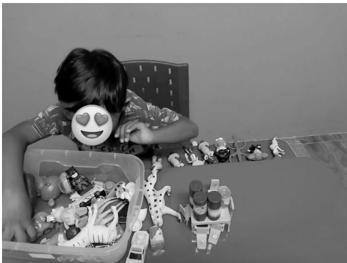
Imagem 2 – Fotografia de uma atividade lúdica realizada por uma criança, com o rosto coberto por um emoji de olhos em formato de coração, preservando sua identidade 7